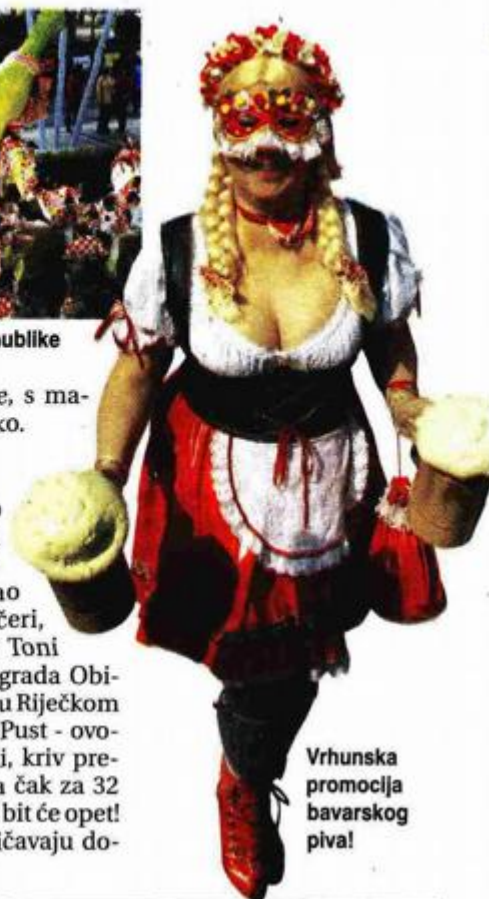
Vrhunska promocija bavarskog piva!