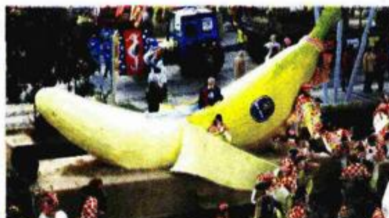
Prije nego što je 8000 maski Obi(l)u vratilo vlast, briljirali su Optimisti iz Banana republike