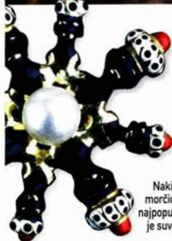
Nakit s morčićima najpopularniji je suvenir