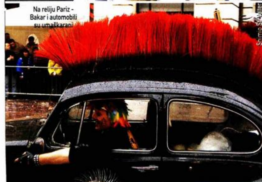
Na reliju Pariz - Bakar i automobili su umaškaranj