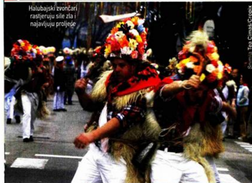
Halubajski zvončari rastjeruju sile zla i najavljuju proljeće