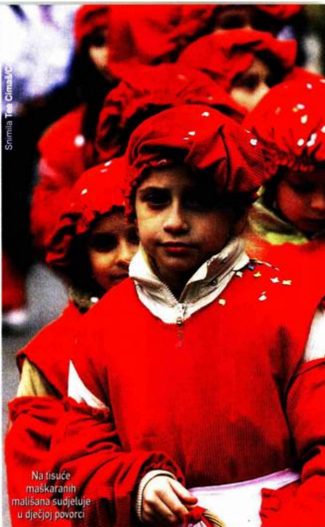
Na tisuće maskaranih mališana sudjeluje u dječjoj povorci